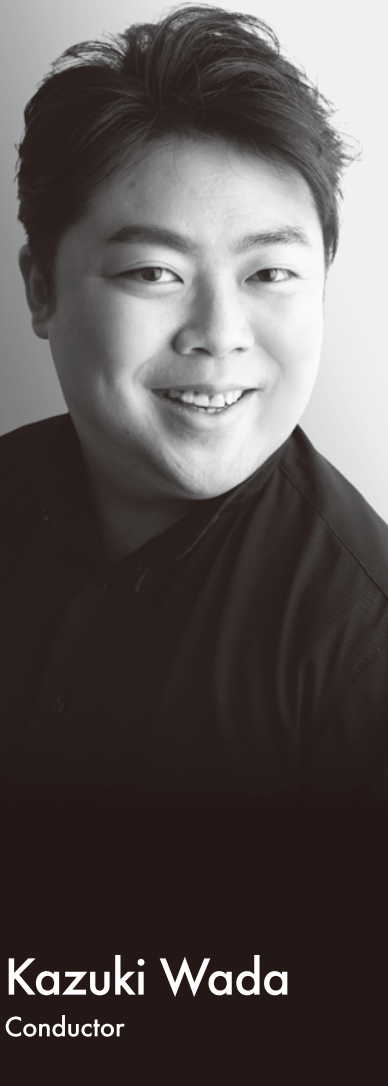
Kazuki Wada Conductor

2020年に楽団創立60周年を迎え、同年1月より大井剛史が正指揮者、トーマス・ザンデルリングが特別客演指揮者、飯森範親が首席客演指揮者、藤野浩一がポップス・ディレクターに就任。