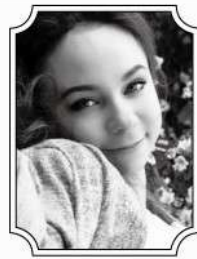
マリア・シュビロワ