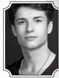
フェディール・ザロディシエフ