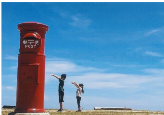
銀賞「ポストくん大きいね」(三重県伊勢市朝熊町 185)