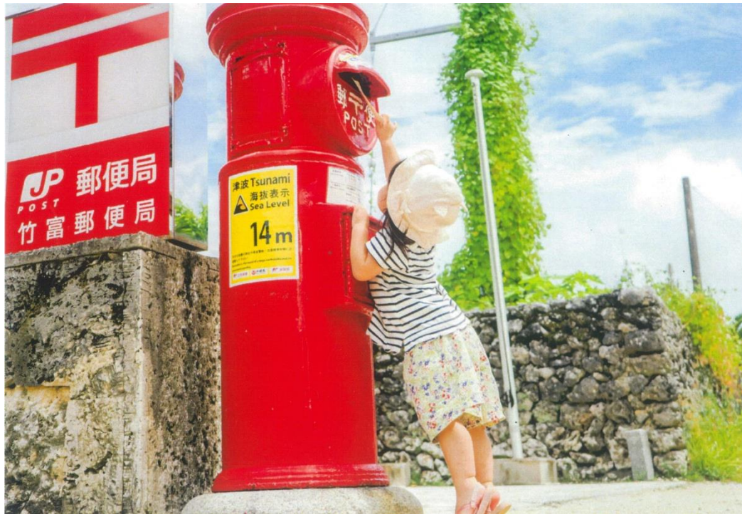
金賞「おばあちゃんにとどけ」(沖縄県八重山郡竹富町竹富500)

国内、海外各地に今も残る丸ポストと人々の暮らしや風景とのかかわりを視点にした457作品が全国から寄せられました。その中から、入賞・入選作品を紹介する作品展を開催します。作品テーマは「国内・外にある丸いポストを題材にした暮らしと風景」です。さまざまな場所、さまざまな顔の丸いポストをじっくりとお楽しみください。