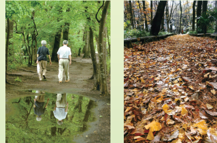
第26回 銀賞「仲よしニコニコ水かかみ」