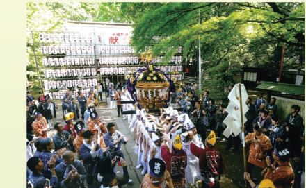
第26回 金賞「早朝の宮出し」