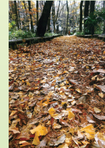
第26回 銀賞「行く秋」