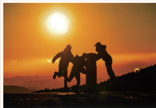
第14回 丸いポストのある風景 ポストカードフォトコンテスト金賞 「5人の青春」