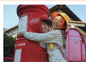
第16回 丸いポストのある風景 ポストカードフォトコンテスト 金賞「ポストさん大好き」 撮影 村田利子さん

■テーマ / 国内・外にある丸いポストを題材にした暮らしと風景 ・2023年1月1日以降に撮影した未発表の作品 (但し、非営利目的として透明袋に入れてください)の個人用ブログ等に掲載したもののみ) ・私設、模型、塗色等も問いません。 ・人物を撮影した場合は肖像権が発生するため、必ずその方の承諾を得てください。肖像権侵害等の責任を主催者は負いかねます。 ■応募資格 / プロ・アマを問いません。 ■応募作品サイズ・点数 / カラープリント「ハガキ」サイズ(限定) ・応募は1人2点まで、入賞は1人1点のみ。 ・組写真は不可。・インクジェットプリンタ出力は可。 ・デジタルの合成・加工は不可。画質調整タッチは可。 ・作品は封書(1点ごとに透明袋に入れてください)で応募のほか、ハガキサイズの印刷紙等にプリントした作品での郵送も可。・作品は返却いたしません。 ■応募方法 / 作品裏面(ハガキの表面)に、下記①~⑦を記入(または記入した用紙を貼付)してください。 ①作品題名 ②氏名(ふりがな) ③住所 ④電話番号 ⑤撮影地(ポストの所在町丁) ⑥撮影年月日(2023年1月1日以降に撮影したものに限り) ⑦応募総点数 ・応募票はルネこだいらホームページからもダウンロードできます。 ■募集期間 / 10月1日(火)~10月31日(木) ※当日消印有効 ■各賞 / 金賞 1点:5万円 銀賞 2点:3万円 銅賞 3点:1万円 小平丸ポスト賞 1点:1万円 努力賞 5点:図書カード ※以上いずれも賞状あり 入選:記念品 ・入賞作品の第一使用権は、主催者に帰属します。 ・入賞作品は、ルネこだいらホームページへの掲載や小平市文化振興財団、日本郵便株式会社等の出版物、電子メディア等に使用することがあります。 ・入賞作品は、オリジナル・データ(フィルムは原版、デジタルはCD)を提出していただきます。 指定期日までに提出のない場合、入賞は取り消しになる場合があります。 ■結果発表 / 入賞者には11月末までに通知。 ■作品展 / 2025年1月11日(土)~3月31日(月) ※入賞・入選作品のみ、ルネこだいら1階情報ロビーに展示します。 ■応募先 / 〒187-0041 東京都小平市美園町1-8-5 ルネこだいら「丸いポストのある風景」ポストカードフォトコンテスト係 ■主 催 / (公財)小平市文化振興財団 ■後 援 / 日本郵便株式会社小平郵便局、小平商工会、小平写真連盟、小平丸ポスト愛好会、こだいら観光まちづくり協会 ■問合せ / (公財)小平市文化振興財団 TEL 042-345-5111 FAX 042-345-9951